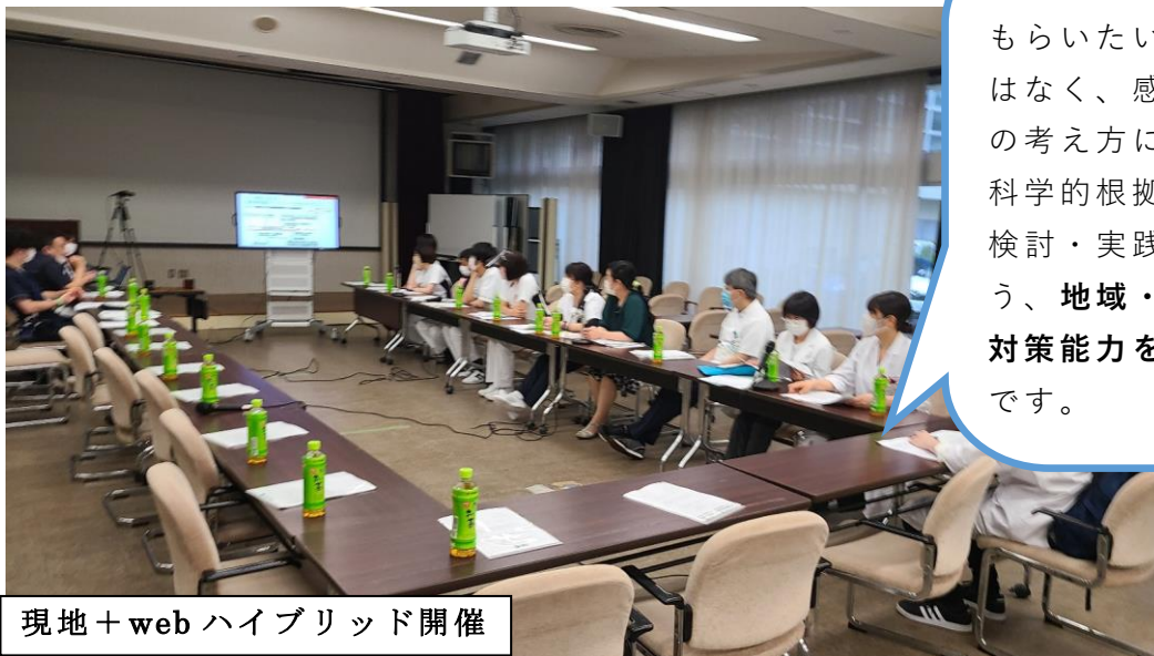
現地+web ハイブリッド開催

感染対策についてただ単にしてもらいたいことを指示をするのではなく、感染症の特性や感染対策の考え方についての理解を深め、科学的根拠に基づき必要な対策の検討・実践が行えるようになるよう、 地域・各施設・各職員の感染対策能力を向上させる ことが目標です。