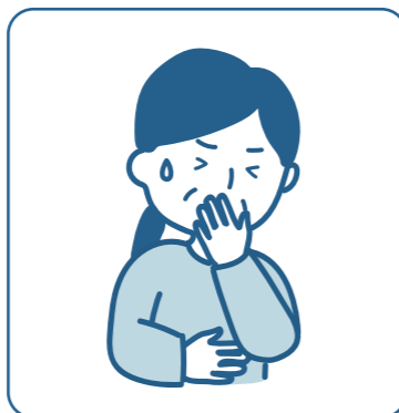
どんさん 呑酸 (酸っぱいものや苦いものが上がってくる)