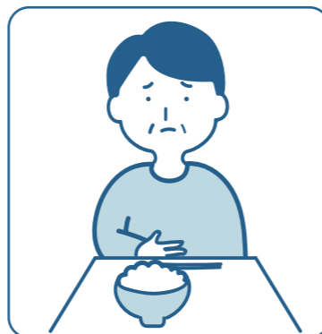
ご飯が食べにくい