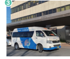
3 京都医療センターバス停

※運行は平日のみです(土曜・日曜・祝日は運休) ※原則、30分間隔で運行しますが、交通事情などにより若干のずれが生じることがあります。特に、午前中や雨の場合は10分~15分程度の遅れが生じますあらかじめご了承ください。巡回バスの遅れにより外来予約時間に間に合わない場合があっても、当センターは責任を負いかねます。 ※巡回バスは京都医療センターで受診される患者さんのために運行致しております。確認のため、診察券・紹介状などの提示を求める場合があります。 ※定員に達し、乗車できない場合があります。