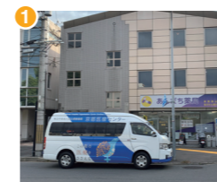
1 近鉄・地下鉄竹田駅バス停