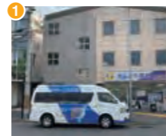
1 近鉄・地下鉄竹田駅バス停

※運行は平日のみです(土曜・日曜・祝日は運休) ※原則、30分間隔で運行しますが、交通事情などにより若干のずれが生じることがあります。特に、午前中や雨の場合は10分~15分程度の遅れが生じますがあらかじめご了承ください。巡回バスの遅れにより外来予約時間に間に合わない場合があっても、当センターは責任を負いかねます。 ※巡回バスは京都医療センターで受診される患者さんのために運行致しております。確認のため、診察券・紹介状などの提示を求められる場合があります。 ※定員に達し、乗車できない場合があります。