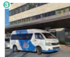
3 京都医療センターバス停