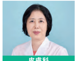
皮膚科 十一 英子 といち えいこ

京都でも数少ない血管外科の専門科です。下肢血流障害による歩行障害は珍しくなく、そのような方の歩行改善をサポートします。