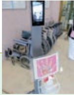
お帰りはこちらから

上記に該当する受診患者様は、専用の待合スペースにご案内します。 上記に該当する方のご面会はお断りしています。