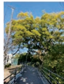
③ 遊歩道沿いの大木 『ツリーハウスできそう』