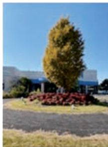
① 玄関前の木 『綺麗に紅葉しています』