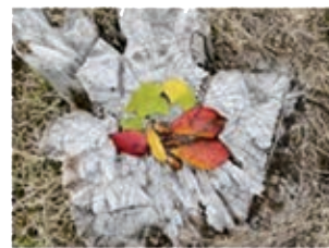
切り株の上にどんぐり 銀杏・桜の落ち葉 『小さい秋見つけた!』