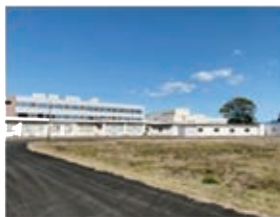
② 子ども心身発達医療センター前から三重病院 『広々していい景色』