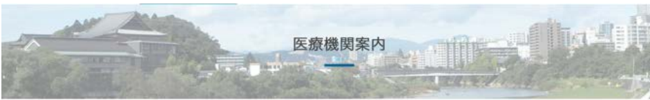
トップページ > 医療機関案内