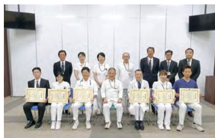
当日授与6人と幹部職員の記念撮影