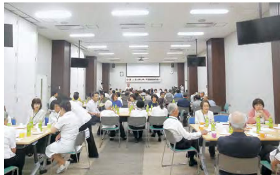
職員とボランティアさんの懇談