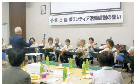
子持ギターマンドリンクラブの演奏