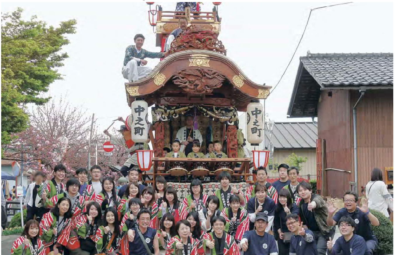
白井宿八重ざくら祭り中之町山車前集合写真