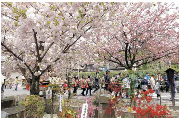
山車を引く当院職員

八重ざくらの開花を祝う、地元では毎年恒例の「第18回白井宿八重ざくら祭り」(渋川市の実行委員会主催・4月21日(日)開催)に今年も参加しました。