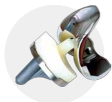
人工膝関節置換術・再置換術