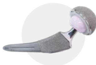
人工股関節置換術・再置換術