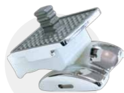
人工足関節置換術