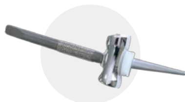
人工肘関節置換術・再置換術