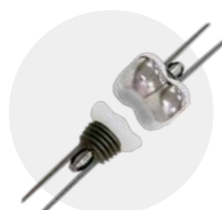
人工指関節置換術・再置換術