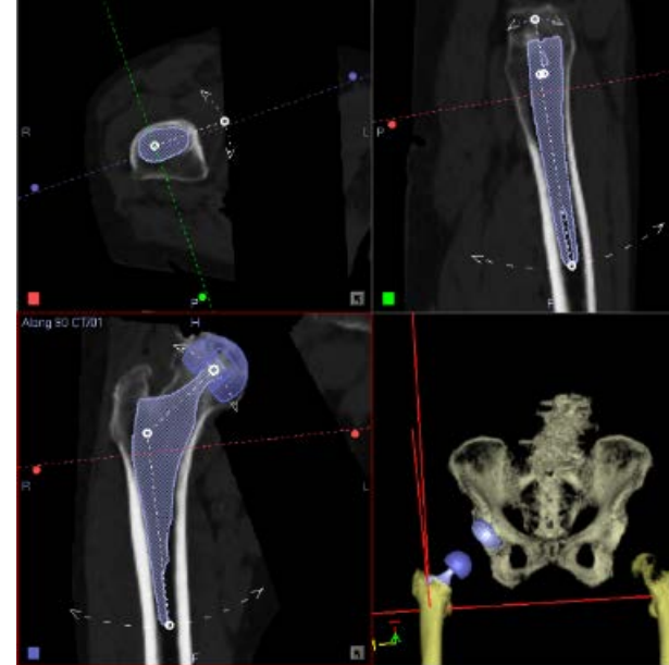
大腿骨側パーツの術前計画