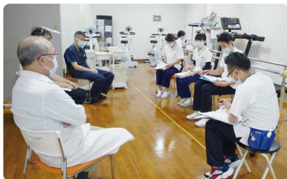
いろいろな職種でカンファレンス

また、最近では少しずつ日常を取り戻していますが、新型コロナによる活動自粛で、高齢者の身体活動量が1週間あたり約60分（3割程度）減少し、運動機能、認知機能の低下や社会参加が減少しているとの報告もあります。当院の外来心臓リハビリテーションは週1回（火曜日の午前）、約60分実施し、運動や生活習慣のアドバイス、栄養状態、食事のアドバイスなどを行っています。患者様から