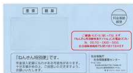
3月までの青色の封筒