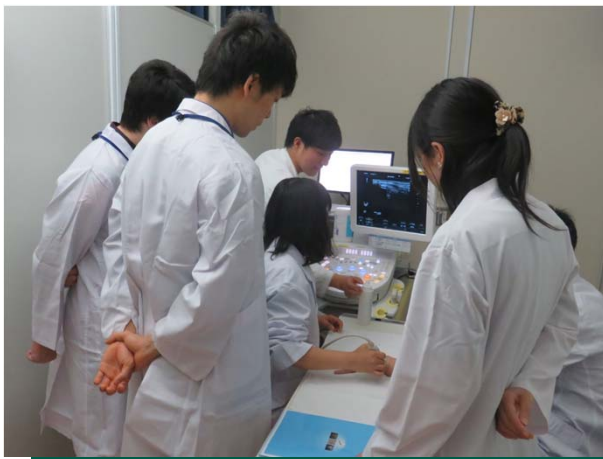
※初期研修医の研修風景