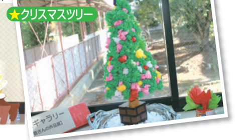
★クリスマスツリー