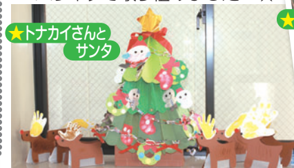
★トナカイさんとサンタ