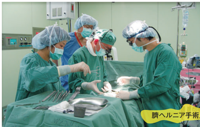
臍ヘルニア手術風景