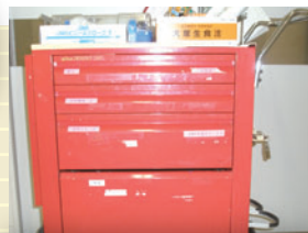
①放射線科の「救急カート」。緊急時の薬品や材料が入っています。

中でも放射線科では早急に対策に取り組み、改善を行いました。(写真②) 各薬品が引きだしの開け閉めなどによって移動することのないよう、厚紙で仕切りを作り、見や