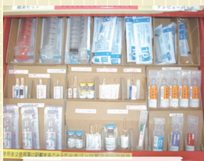
②見た目もすっきり。安全に取り出せるようになった薬剤

当院では「緊急カート」から安全に薬を取り出すことが出来るように、薬の配置の見直し・改善を行っています。