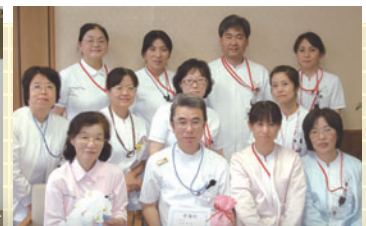
③手前味噌ですが…プチ表彰式の後、受賞者を囲んで

すく取り出しやすいよう底は斜面に作ってあります。ちょっと、写真ではわかりにくいかもしれませんがね。これで、どんなときでも、誰でも、すばやく確実に安全に薬品を取り出すことができます。そこで、担当の技師長に看護部と医療安全管理室から感謝状を送りプチ表彰を行いました。