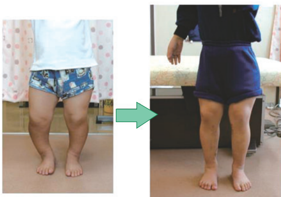
13歳時、膝下の変形矯正、脚延長10cm施行

適応年齢は、治療に取り組める8歳頃から成人に至るまでです。治療期間は長期となりますが、入院期間は緑ヶ丘特別支援学校に通学し、学業と治療を両立することができます。