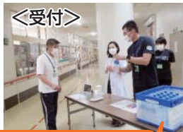
＜受付＞ 熱中症予防のスポーツドリンクです。