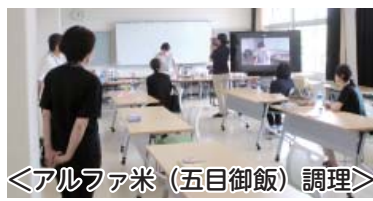
＜アルファ米（五目御飯）調理＞

生徒、保護者、学校職員総勢24人で作業を行いました。天気が良くとても暑い日でした。