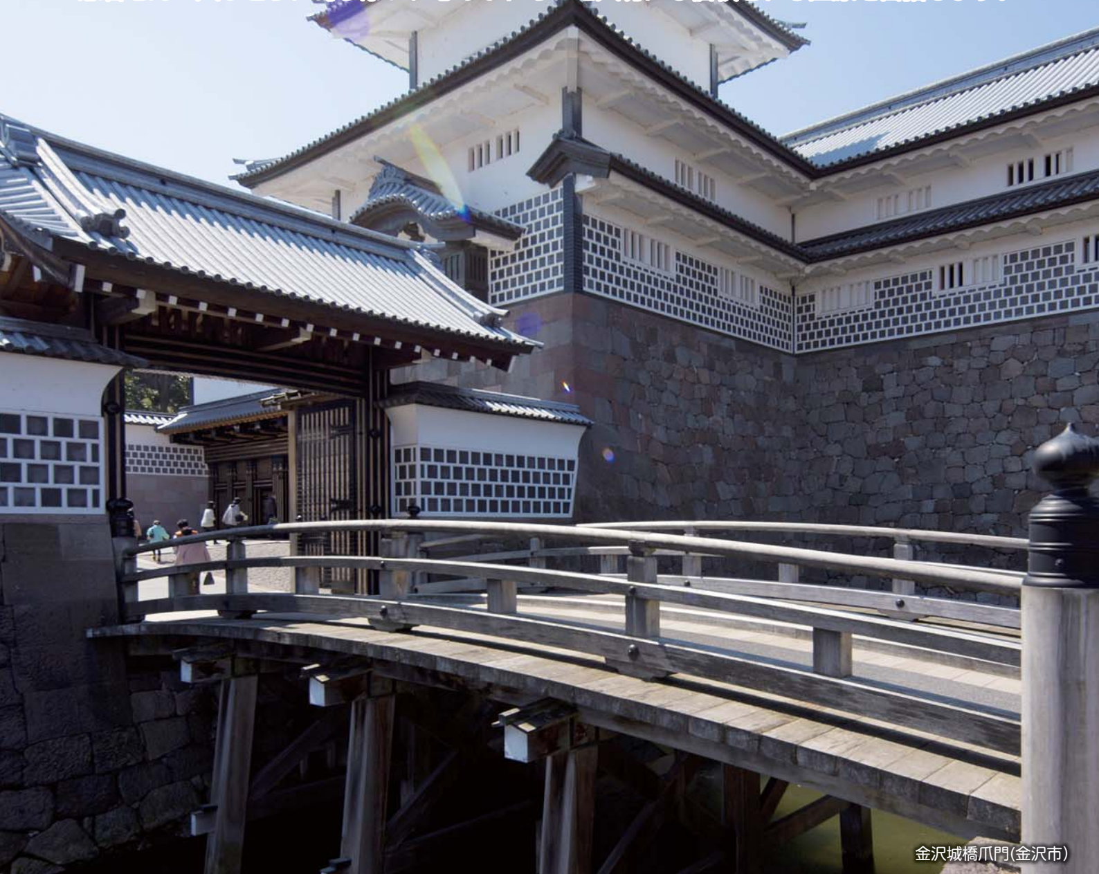
金沢城橋爪門(金沢市)