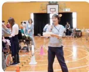
感染予防の説明 「手指消毒をしましょう」

ここでは紹介しきれなかった行事、授業の様子などがたくさんあります。日々の児童生徒の授業、行事の様子や自然に囲まれた校舎の様子などを学校ホームページで紹介します。