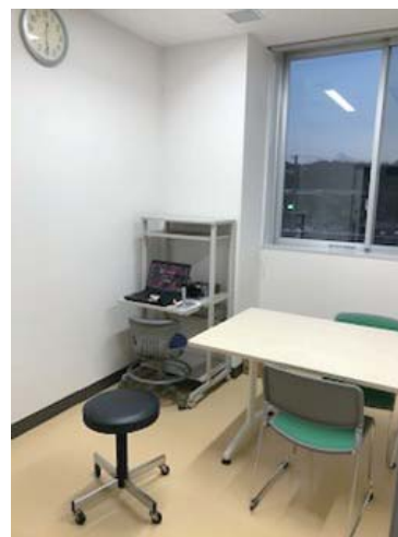
言語・摂食嚥下機能療法室