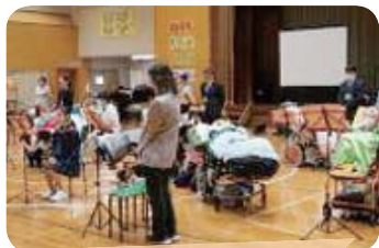
全校合唱 「遠い日の歌」