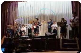
小中高ステージ発表 「Lemon」の合奏

ステージ発表、コーナーの模擬店、作品展示などで、児童生徒の普段の学習成果がとても感じられました。今年度の文化祭も思い出に残る、とても楽しい時間となりました。病院スタッフの皆様、保護者の皆様ありがとうございました。