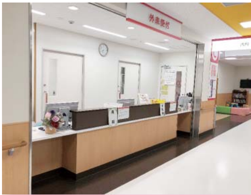
外来受付 外来受付向かって右が小児科受付、 左が内科受付です

皆さま方からの様々なご相談やご意見に応じ、信頼のおける質のよい医療とケアが提供できるよう、外来スタッフ一同努めてまいります。