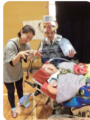
分教室 「牛魔王社長と一緒に」