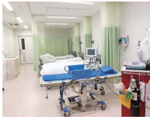
救急処置室 外来での点滴治療は、写真奥のベッドで受けていただきます。