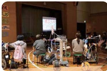
分教室映像発表 「天竺への道」