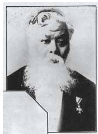
岸田吟香

岸田は様々な仕事をしており(ジャーナリスト、実業家。卵かけご飯を広めた!)、一言では言い表せない人物だが、幕末に眼病を患ったときヘボン(宣教師、医師、ヘボン式ローマ字で名を遺す)に目薬の処方を教えてもらい、「精錡水(せいきすい)」を販売した。のちに東京日日新聞(現、毎日新聞)の主筆になり、同紙で精錡水を大々的に宣伝し、大ヒットさせている。