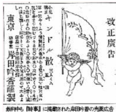
係争中の岸田吟香による広告 (参考文献2より)

余談になるが、明治の新聞経営は赤字であり、どこも広告収入は喉から手が出るほど欲しかった。時事新報の