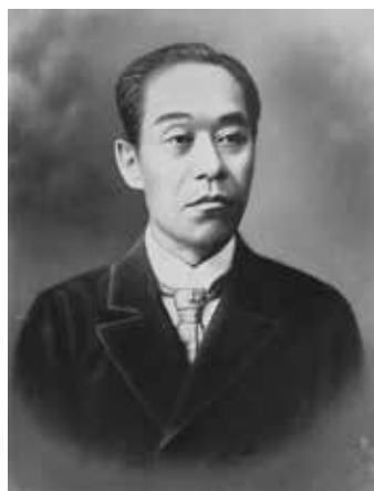
福沢諭吉

明治15年10月、太政官布告として「売薬印紙税規則」が公布され、売薬の定価に1割の税が付加されることになった。