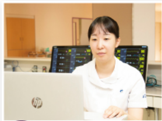
9:10 電子カルテでの情報収集