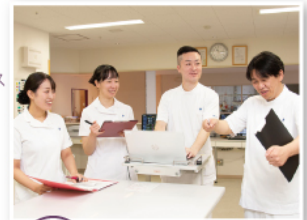
2:30 チームカンファレンス