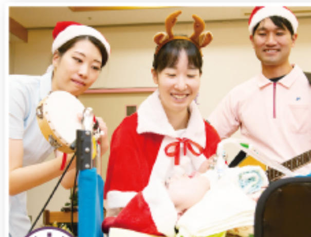
3:00 レクリエーション