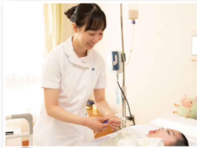
10:00~ 患者ケア (水分補給)