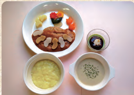
嚥下食(ゼリー状の料理)