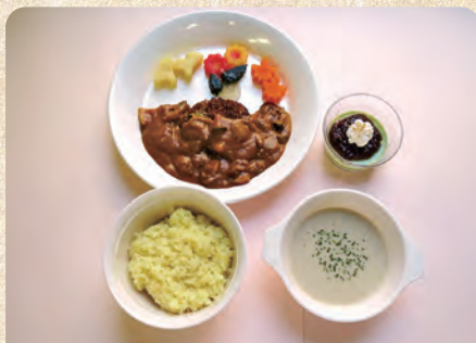
軟菜食(一口大の料理)