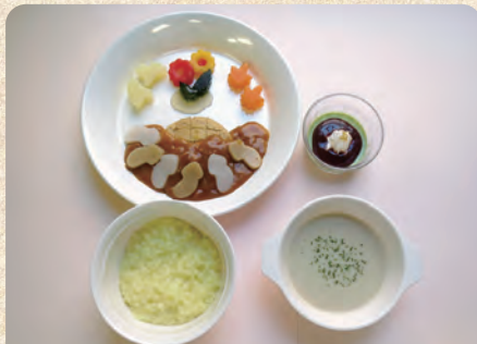
移行食(1cm角軟らか料理)