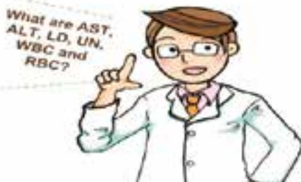
英語版のミニ知識

Aha! Clinical Tests Basic information 2nd edition