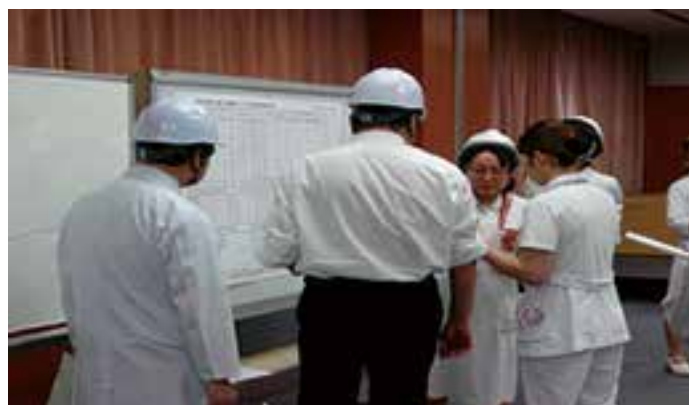
〈災害対策本部 被害状況報告〉