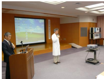
四元院長のご挨拶