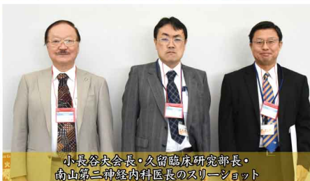
小長谷大会長・久留臨床研究部長・ 南山第二神経内科医長のスリーショット