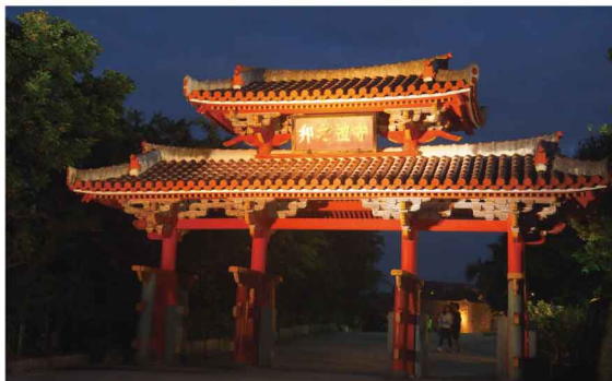
第70回国立病院総合医学学会にて(沖縄県)