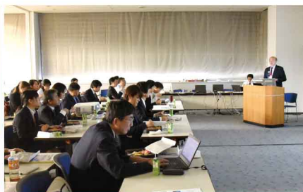
ランチオンセミナーの様子