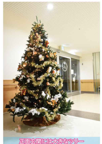
正面玄関には大きなツリー

ことで良い人間関係を形成し、更に信頼していただけるようになりたいと頑張っています。