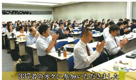
337名の方々に参加いただきました