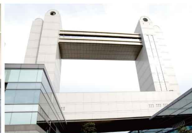
天候にも恵まれました