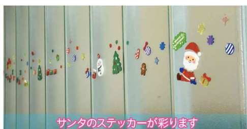
サンタのステッカーが彩ります