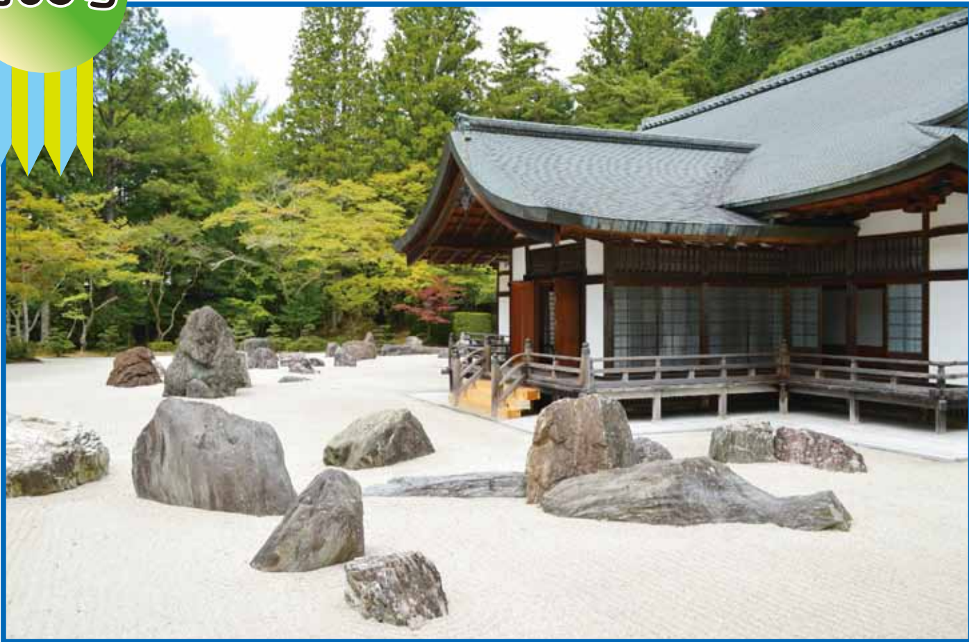
高野山 金剛峯寺 蟠龍庭 ばんりゅうてい