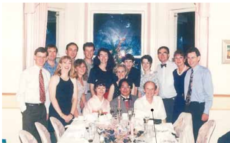
ジョン・デント教授