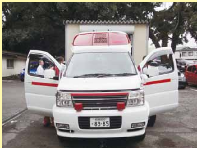
《新たに配備された救急車で訓練に出発！》