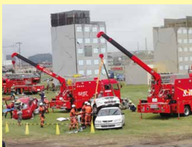
《乗用車内にとりのこされた負傷者を救助する訓練。》