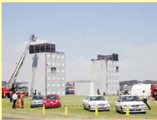
《模擬ビル屋上に避難した被災者を救助する訓練。》

起きるかわからない災害に向け、皆を中心に今後も平素から実践的な訓練を重ね、備えを確かなものにしてほしい」と話しました。