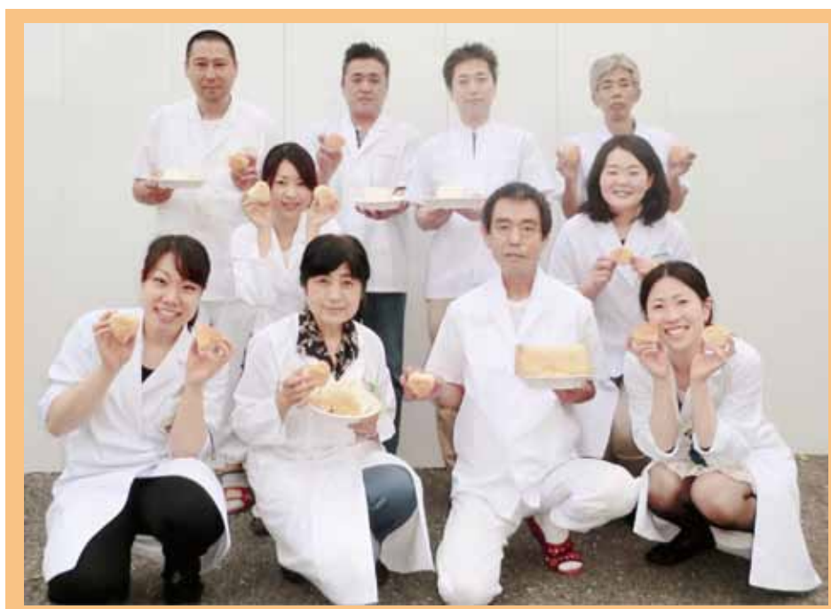
《栄養管理室 with 米粉パン》

患児の食生活をより豊かにするため、これからも心こもった食事提供を心がけて参ります。