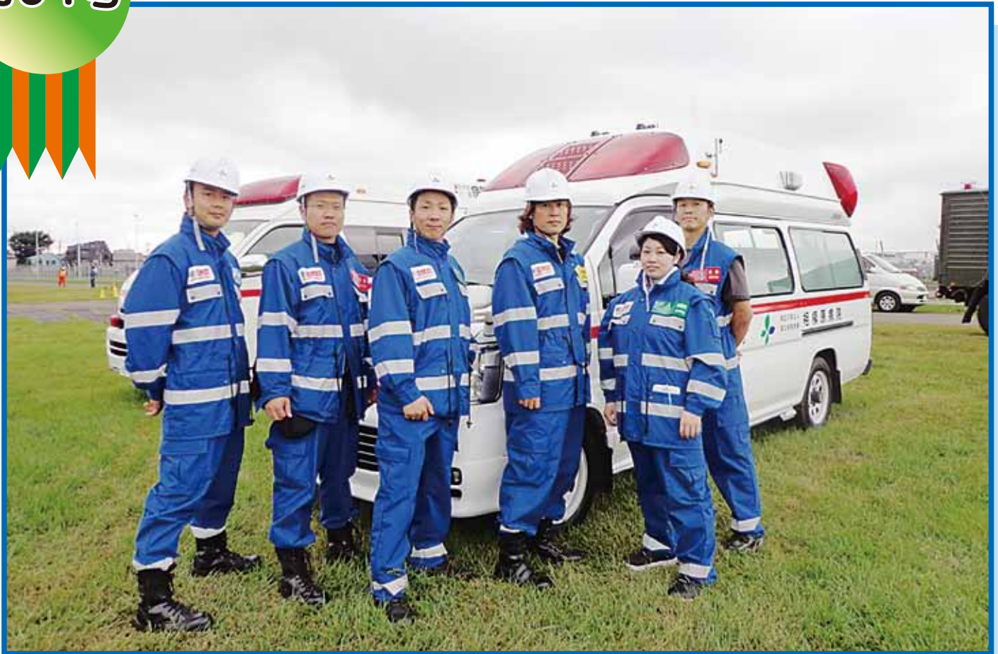
九都県市合同防災訓練 当院参加メンバー（後ろは当院に配備された救急車）