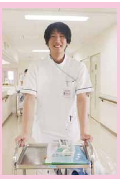
《今日も笑顔でがんばっています！》

入職当初は不安がありましたが、今は先輩方のわかりやすいご指導のおかげで病院勤務に少しずつではありますが慣れてきています。現場は毎日が勉強で、基本の応用が必要です。