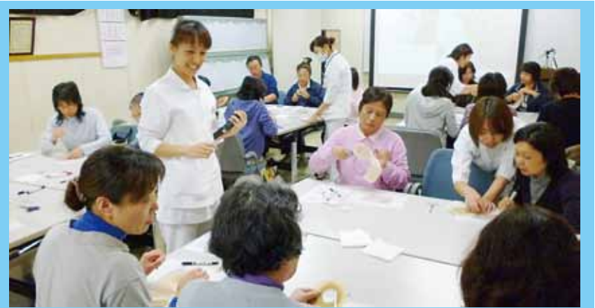
《介護職対象ストーマケア公開講座の様子》

今後も一つひとつの事例を積み重ね、経験年数が少ない看護職員も当たり前で退院支援ができるように育成していきたいと考えています。