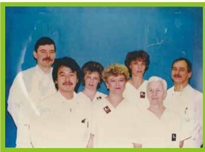
《ドイツ時代の筆者(左から2人目)》

私が相模原病院に赴任したのは平成3年4月でした。それ以前私は2年間北ドイツのBraunschweig(ブラウンシュヴァイク)市民病院に臨床医として勤務しており、内視鏡治療、手術などを行っていました。ただ当時、日本の実践病院への現場復帰には少なからず不安を抱