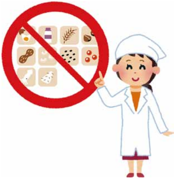
《主要食物アレルギー10項目》

昨年度より、栄養管理室では小児食物アレルギー食の充実に向けた取り組みを行ってきました。その結果、「できることから始めよう！国立病院機構QC（※Quality Control=品質管理、業務改善）活動奨励表彰」にて、優秀賞をいただく事ができました。