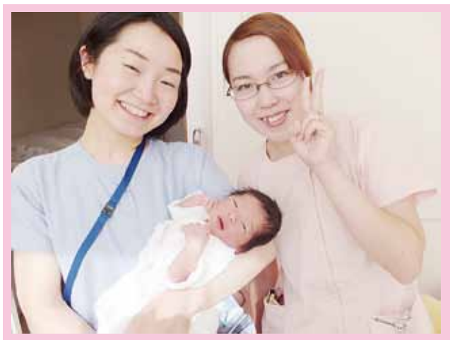
《病棟で誕生した赤ちゃんとの記念撮影》 ※撮影・掲載許可をいただいております。

赤ちゃんとお母さん、先輩方からたくさんの学びを得ながら、助産師として一歩一歩、成長していけたらと思います。