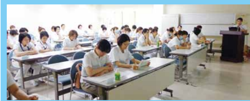
《熱心に講義に耳を傾ける受講者たち》

相模原病院は平成23年9月に地域医療支援病院に承認されました。地域に密着し信頼されて選ばれる病院になるためには、「断らない医療」をしっかりと実践していく必要があります。そのためには職員全員が地域医療支援病院としての当院の役割を認識していることが大切です。