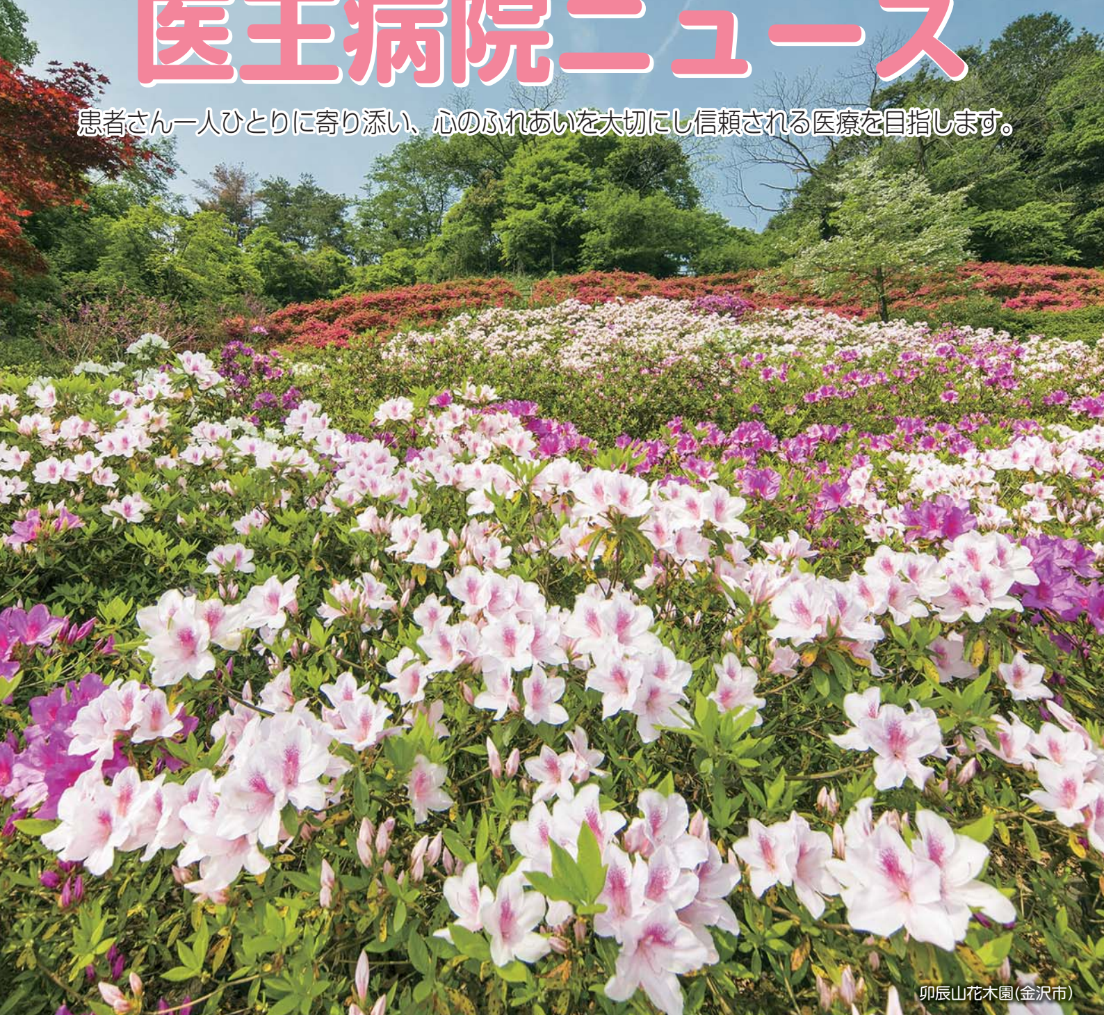
卯辰山花木園(金沢市)

患者さん一人ひとりに寄り添い、心のふれあいを大切にし信頼される医療を目指します。