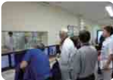
放射線科ツアーの様子