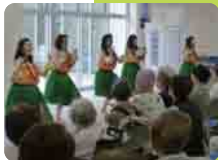
好評だったフラダンスショー

初めての試みが多く、反省点もあるのですが各部署の職員が協力してこのイベントを成功させたことは、大きくなった病院内での結束を深める事になりました。